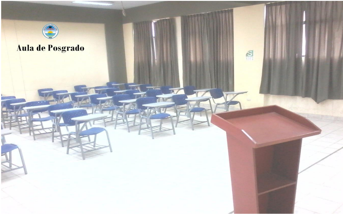
Aula de Posgrado

LAS AULAS SE ENCUESTRAN IMPLEMENTADAS CON MODERNOS EQUIPOS DE ULTIMA GENERACIÓN Y ALTA RESOLUCIÓN