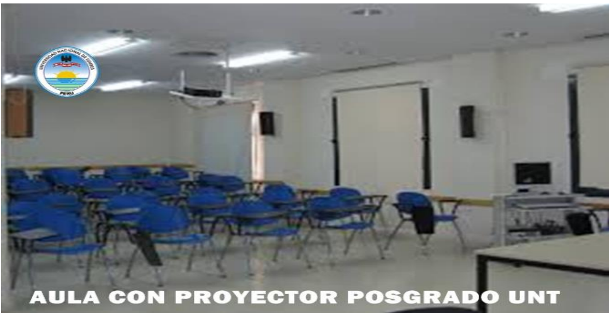
AULA CON PROYECTOR POSGRADO UNT

LAS AULAS SE ENCUESTRAN IMPLEMENTADAS CON MODERNOS EQUIPOS DE ULTIMA GENERACIÓN Y ALTA RESOLUCIÓN